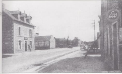
Le carrefour, sur l'ancienne route Paris-Brest, à Saint-René. Le café sur la gauche est maintenant remplacé par une pharmacie.