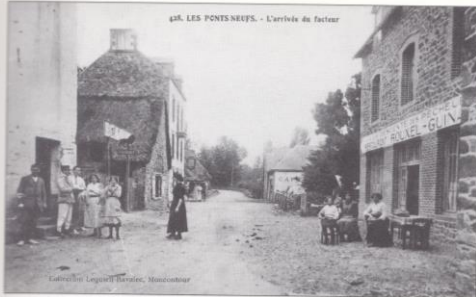
Le site des Ponts-Neufs est en partie sur Hillion et sur Morieux. On attend avec impatience l'arrivée du facteur, en face de l'hôtel Rouxel-Guinard.