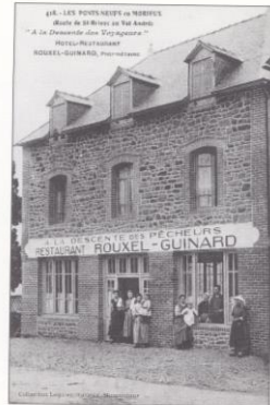
L'hôtel Rouxel-Guinard, l'un des restaurants réputés des Ponts-Neufs, était le paradis des pêcheurs de la région.