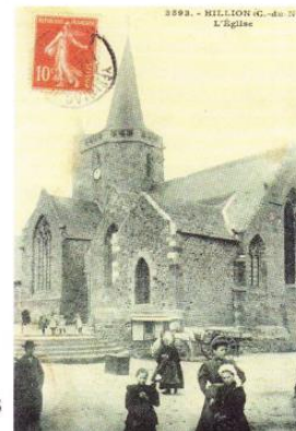
Extérieur de l'église vers 1900