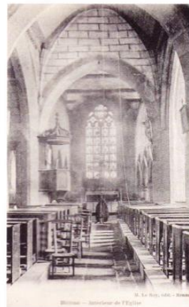
L'intérieur de l'église avant 1960