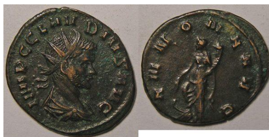
Monnaie frappée sous Claudius II le Gothique (263-270), identique à celle trouvée à Hillion