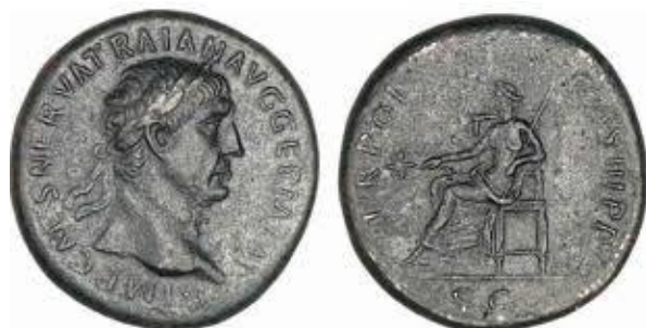
Monnaie frappée sous Trajan en 106 ap JC, identique à celle trouvée à Hillion